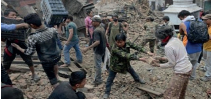
Premières recherches des survivants à Katmandu.

Cette double catastrophe naturelle a causé des dégâts matériels et humains majeurs à la nation en détruisant un nombre impressionnant de maisons d'habitation, de bureaux, de monuments, d'écoles, de routes, de réseaux d'eau, etc.. Sans parler des gros dégâts psychologiques subis par une population déjà très pauvre (Le Népal est le 140ème pays le plus pauvre du monde à l'indice de pauvreté sur 180...), et qui vit désormais dans la peur et le stress permanent, à tel point que bon nombre de Népalais refusent encore de rejoindre leurs habitations préférant dormir sous tente. De toutes les façons, on ne connaîtra jamais le bilan définitif de cette catastrophe, tant la gestion de l'état civil népalais est déjà en temps normal plus qu'aléatoire.