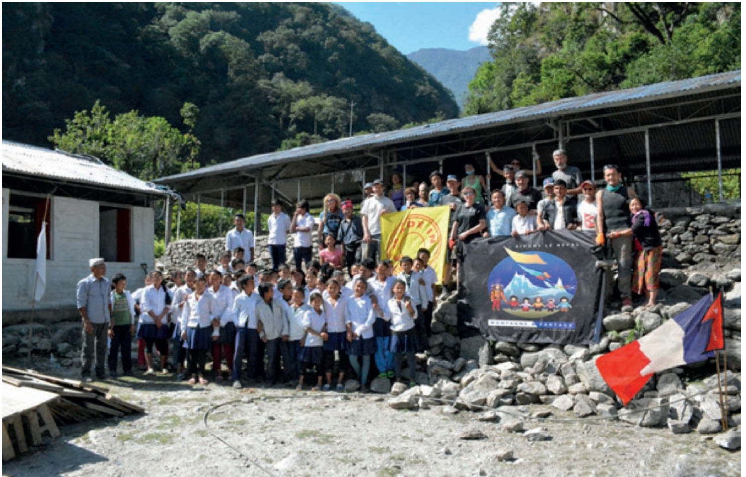
Photo souvenir avec les enfants de Gola.