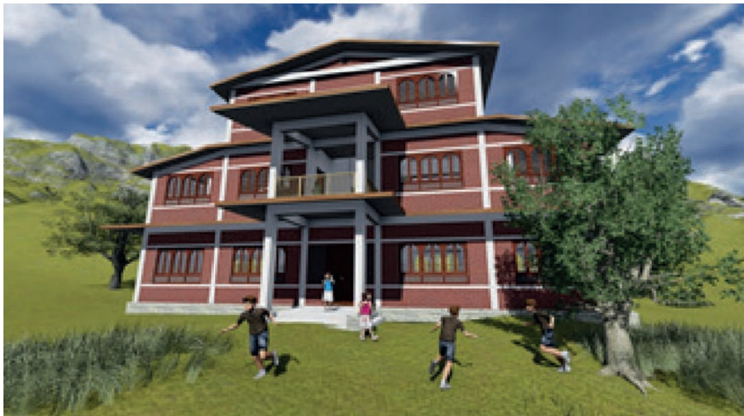
Projection en 3D du futur projet.

Selon les experts dépêchés sur place, la Salyantar Higher Secondary School a subi des dégâts irrémédiables au point qu'il n'est pas pertinent de la réparer avec les moyens du bord, mais plutôt de la reconstruire de toutes pièces, sur un nouveau site mis à disposition par Le Village Development Committee, en y intégrant les nouvelles normes parasismiques désormais applicables au Népal pour les bâtiments publics. Des discussions ont été engagées sur place par Pemba Sherpa, correspondant permanent de Montagne & Partage au Népal pour recueillir le point de vue des responsables villageois. Tous s'accordent à l'idée de reconstruire entièrement l'école sur un autre site dédié, mis à disposition par la Municipalité, mais surtout avec des techniques et matériaux susceptibles de résister à d'éventuels autres tremblements de terre.