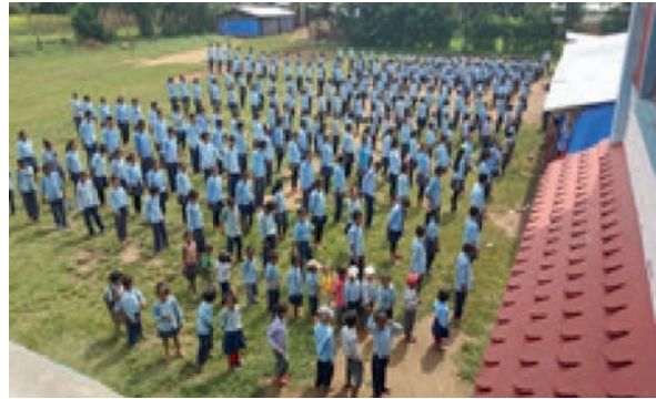
Pour que les enfants du Népal retrouvent le plaisir d'apprendre...

UN GRAND MERCI A TOUTES CELLES ET TOUS CEUX QUI SOUTIENNENT ACTIVEMENT MONTAGNE & PARTAGE DANS SON ACTION HUMANITAIRE EN FAVEUR DES POPULATIONS DÉFAVORISÉES DU NÉPAL, PARTICULIÈREMENT AUPRÈS DES ENFANTS.