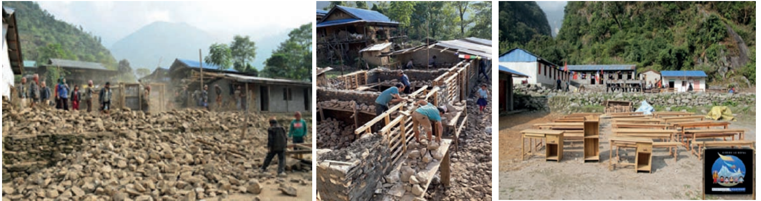
L'école de Karmarang a beaucoup souffert, mais la reconstruction est en cours.