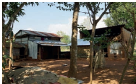
Vue générale du village de Salyantar avant le séisme, et type d'habitations traditionnelles