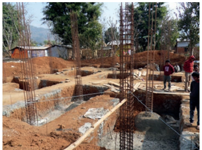
Les nouvelles normes parasismiques de construction sont appliquées à ce projet, à la grande satisfaction des futurs utilisateurs, encore bien marqués par les dommages matériels et humains causés par les séismes du printemps 2015.

Les travaux ont commencé... intégrant les options bibliothèque et salle informatique. Un projet exemplaire.