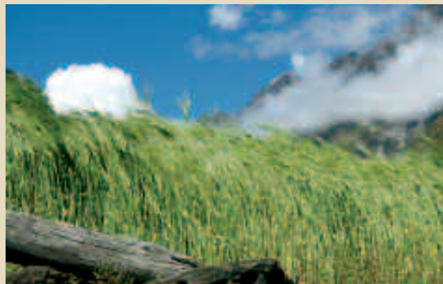
Scène pastorale sur la route du Manaslu.

MONTAGNE & PARTAGE reste une petite association humanitaire, efficace et proche de la réalité du terrain grâce à l'action inestimable de notre correspondant officiel au Népal, Pemba Sherpa. MONTAGNE & PARTAGE se veut aussi exemplaire au niveau de sa gestion totalement bénévole et de ses frais de fonctionnement réduits à leur plus simple expression ( 1,47% de nos recettes en 2013 ). Cela aussi, c'est notre fierté.