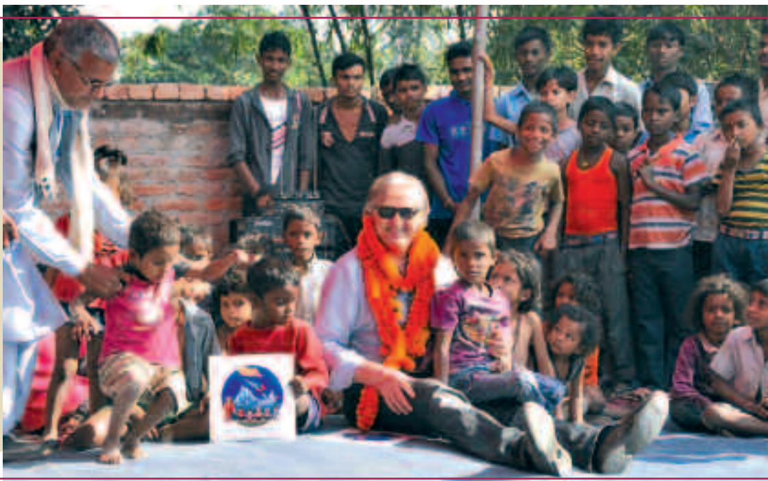
Le Président en compagnie des enfants de l'Ecole de Janta Ma Vi.

La tradition est maintenant bien établie. En début d'année, ces d'informations ont pour modeste ambition de vous tenir informé sur les activités et projets de MONTAGNE & PARTAGE.